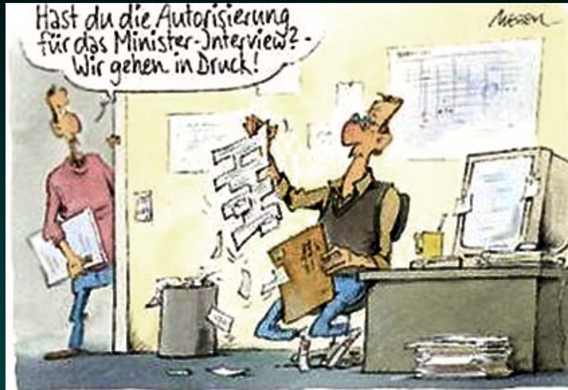
Quelle: Swantje Waterstraat: Die Autorisierung politischer Presseinterviews